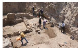
トルコ共和国カマン・カレホコック遺跡発掘現場